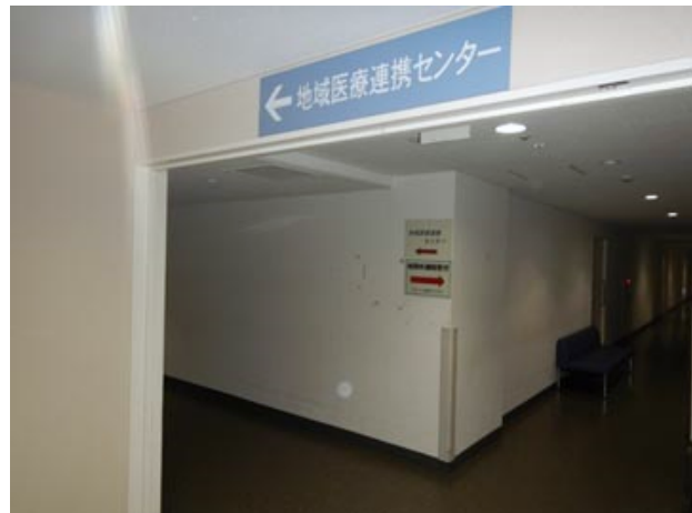
④一つ目の角を左へ進む