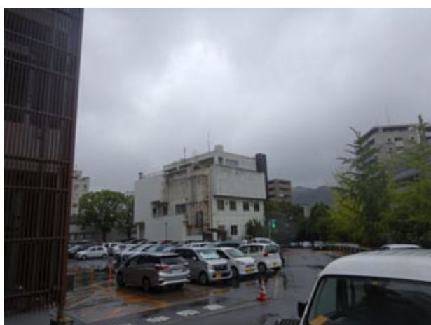
③建物を通り過ぎて