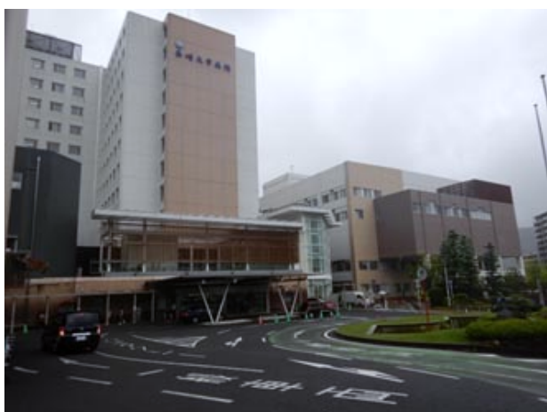
①大学病院正面の右側へ進む