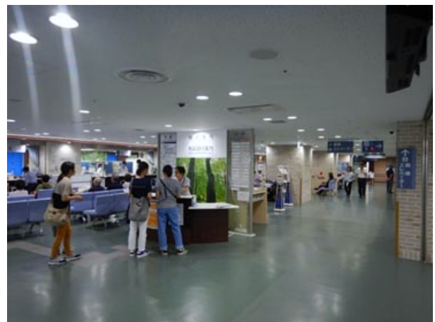
②正面玄関をに入って、まっすぐ進む