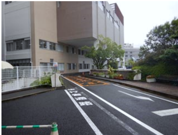
②建物手前を通り奥に進む