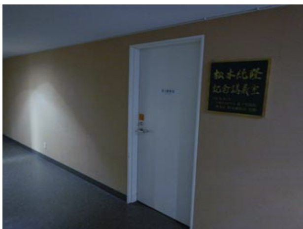
⑤左手に会場入り口