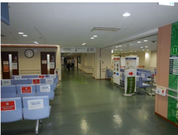
③突き当りを左へ進む